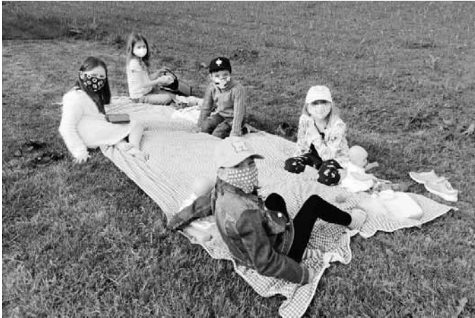
Schulkinder der Notgruppe ließen nach getaner Arbeit im Klassenzimmer den Vormittag im Schulgarten ausklingen.