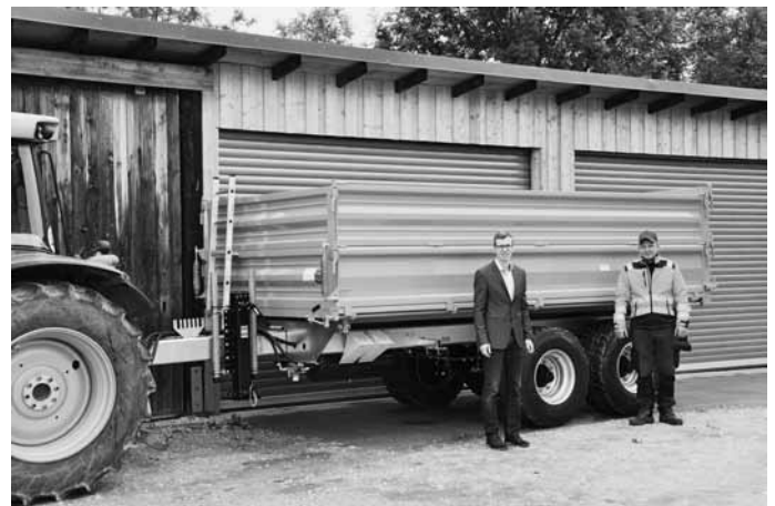
BM Wagner und Bauhofleiter Rieker nehmen den neuen Anhänger in Empfang.

Der Anhänger lässt den Bauhof effizienter und damit noch ökonomischer arbeiten. Unter Berücksichtigung der Inzahlungnahme des bestehenden Hängers sind Kosten von rund 22.000 € angefallen.