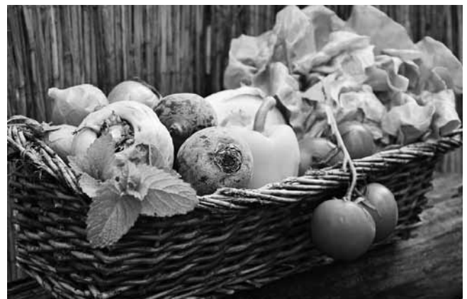
Frischer geht nicht – Obst und Gemüse mit regionalen Wurzeln

Sie bieten selbst Produkte aus dem Raum Bad Boll an und sind bisher nicht Teil des neuen Internetangebots? Kein Problem. Wenn Sie dabei sein möchten, schreiben Sie einfach eine E-Mail an hentschel@gvv-boll.de (Frau Hentschel). Sie erhalten dann ein Formular, in das Sie Ihre Produkte und alle weiteren Informationen eintragen können, noch ein zwei schöne Bilder dazu – dann ist auch Ihr Angebot demnächst online zu sehen. Der Eintrag ist übrigens kostenlos.