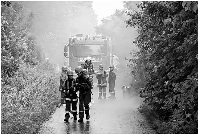
Beim Brand im Dürnauer Bauhof musste eine Person noch aus dem verrauchten Schuppen gerettet werden.