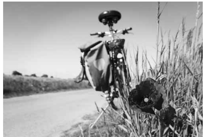
Alltagsradeln liegt im Trend

Auch in diesem Jahr machen die Mitgliedsgemeinden der NI-Region Raum Bad Boll wieder bei der bundesweiten Aktion „Stadtradeln“ mit. Wer also jetzt mit dem Radfahren starten möchte und dabei noch in einem Wettbewerb Kilometer für die eigenen Gemeinde sammeln möchte, kann sich noch bis zum 31. Juli 2020 anmelden und mitmachen. Mehr Infos: www.stadtradeln.de . Dort im Suchfeld „GVV Raum Bad Boll im Landkreis Göppingen“ eingeben, sich registrieren und losradeln!