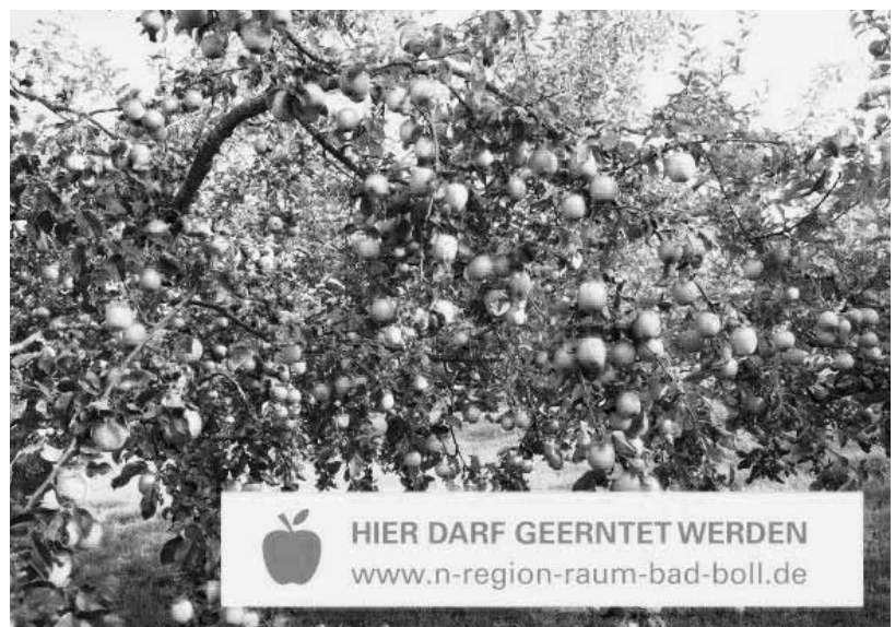
Baum mit Ernte-Band versehen, dann dürfen andere ernten!

Mehr Informationen zur N!-Region gibt es unter: www.n-region-raum-bad-boll